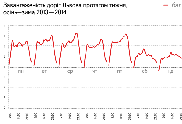
Завантаженість доріг Львова протягом тижня, осінь—зима 2013—2014

В інших містах у вихідні на дорогах переважно вільно, а от швидко проїхати Львовом не вийде навіть у суботу і неділю: вузькі вулички та бруківка не дають розігнатися. У вихідні затори тут рідко бувають нижчими за 4 бали, а максимальна завантаженість припадає на середину дня.